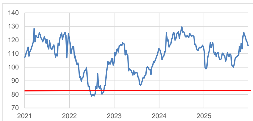
SFS-Chart mit Barriere (rote Linie)

Dieses Produkt erhalten Sie bis zum 02.04.2026, 12:00 Uhr, aus Emission. Sie bezahlen keine Courtage.