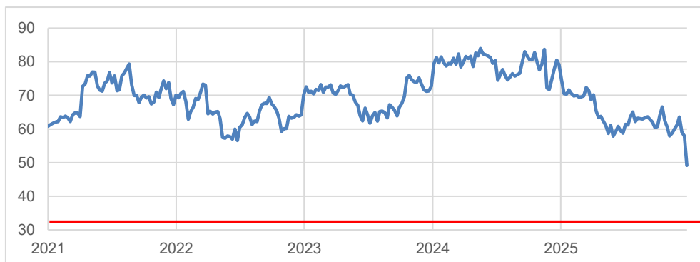
Alcon-Chart mit Barriere (rote Linie)

Dieses Produkt erhalten Sie bis zum 19.05.2026, 14:30 Uhr, aus Emission. Es fällt keine Courtage an.