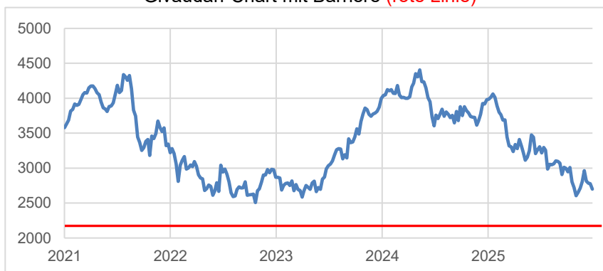
Givaudan-Chart mit Barriere (rote Linie)

Dieses Produkt erhalten Sie bis zum 26.05.2026, 12:00 Uhr, aus Emission. Es fällt keine Courtage an.