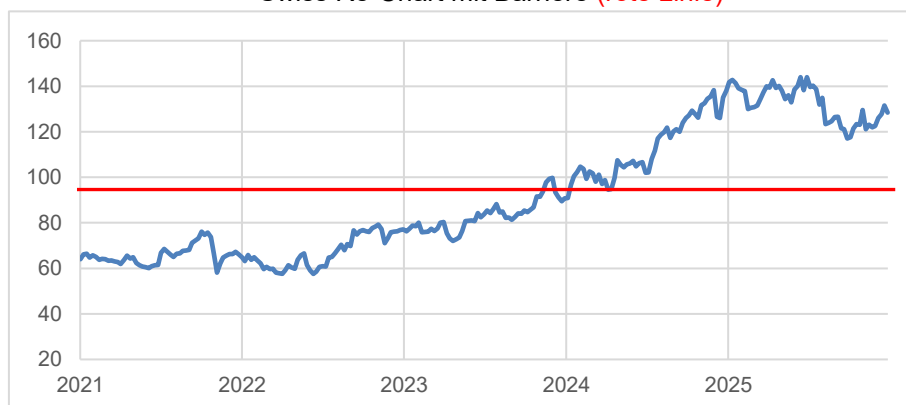
Swiss Re-Chart mit Barriere (rote Linie)

Dieses Produkt erhalten Sie bis zum 05.05.2026, 12:00 Uhr, aus Emission. Es fällt keine Courtage an.