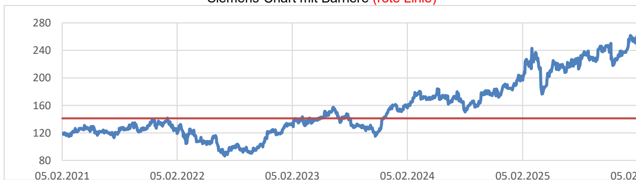
Siemens-Chart mit Barriere (rote Linie)

Dieses Produkt erhalten Sie bis zum 12.02.2026, 16:00 Uhr, aus Emission. Sie bezahlen keine Courtage.