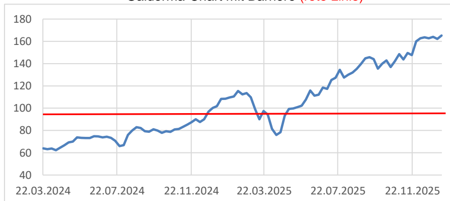
Galderma-Chart mit Barriere (rote Linie)

Dieses Produkt erhalten Sie bis zum 19.01.2026, 14:30 Uhr, aus Emission. Sie bezahlen keine Courtage.