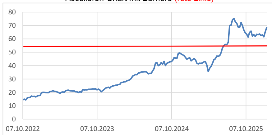
Accelleron-Chart mit Barriere (rote Linie)

Dieses Produkt erhalten Sie bis zum 27.01.2026, 12:00 Uhr, aus Emission. Sie bezahlen keine Courtage.