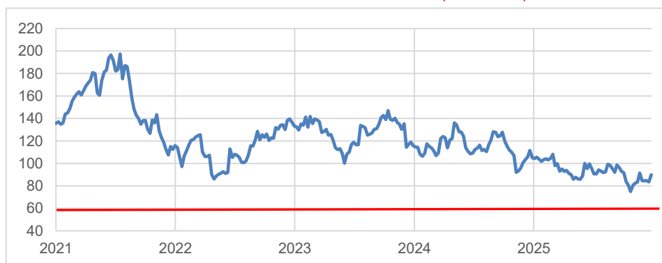
Straumann-Chart mit Barriere (rote Linie)

Dieses Produkt erhalten Sie bis zum 2.06.2026, 12:00 Uhr, aus Emission. Es fällt keine Courtage an.